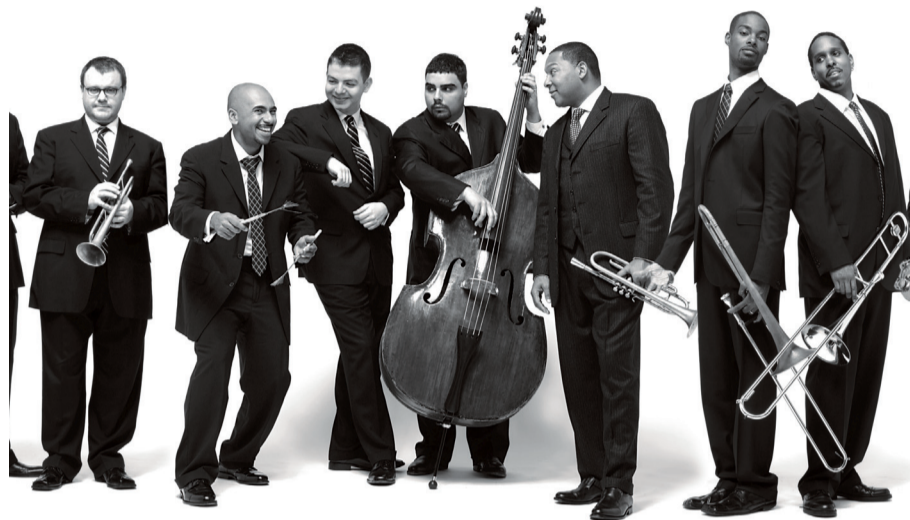
Participará la Jazz at Lincoln Center Orchestra

En la década de los 80 trabajó con el mí-